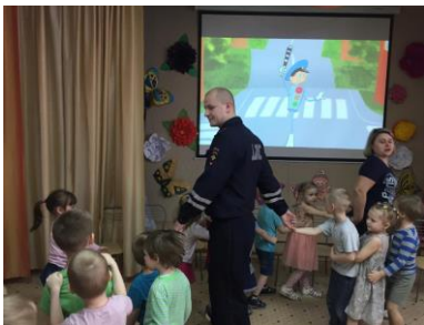
Досуг для детей старшего дошкольного возраста «Дорожная безопасность»