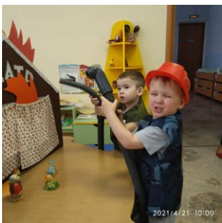
Досуг для детей младшего дошкольного возраста «Дядя Степа в гостях у ребят»