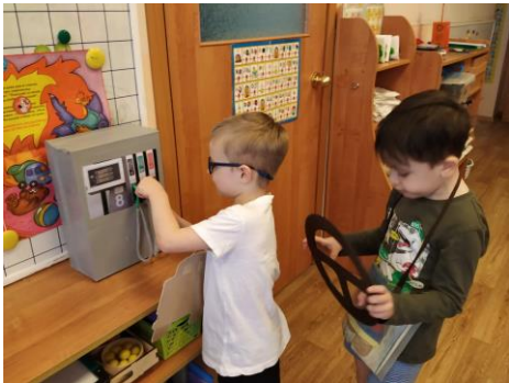
Сюжетно-ролевая игра «Мы -пожарные», «Автозаправочная станция»