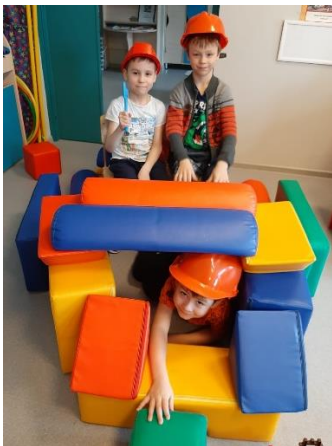
Театрализованная игра «Тили-тили, тили-бом, загорелся кошкин дом!»